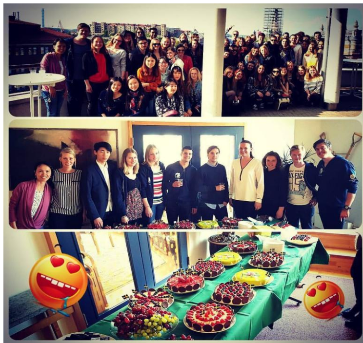
富有瑞典特色的甜品盛宴

几天的适应过后开始了学习生活。先前就听学姐说过一开始上课会很痛苦，因为在国内没有受过全英语教学的训练，果然如此。在国内我的英语水平还算不错，可是在学术类英语我也只能算初级水平。上课既要查询记住单词的意思，又要紧跟老师讲课的步伐，实在有些手忙脚乱，一同来交换的朋友甚至将老师所讲的课在手机里录音，回家再反复听。为了让自己不会被越甩越远，我从一开始就努力学习。国外大学的课并不多，隔一天一次课，一堂课持续半天，并且瑞典的课程设置很有意思，一个月一门课，迫使学生早做准备。每次上完课我都回去翻看老师的讲义，遇到不会的词绝不含糊，及时查释义并作标记，后来发现高频词汇用的多了也就自然而然记住了。国外大学的课从内容上来说不难，难就难在我们需要将所学过的中文知识转换成英文。坚持了两个星期开始初见成效，在之后的学习中能听懂的越来越多，直到最后一门课老师所讲的内容几乎完全能听懂。在自己的不懈努力下，第一门课也取得了 high pass 的好成绩，这对我的信心是一个极大的提升。国外大学课的种类也很多，经济、金融，还有一些富有当地特色的课程，比如研究瑞典的福利。选这些课既可以了解当地的文化体制，更好的融入进去，又可以更多的和来自世界各地的同学交流各国风情，是一